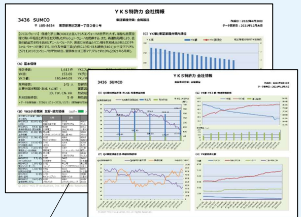
5) YKS特許力 会社情報